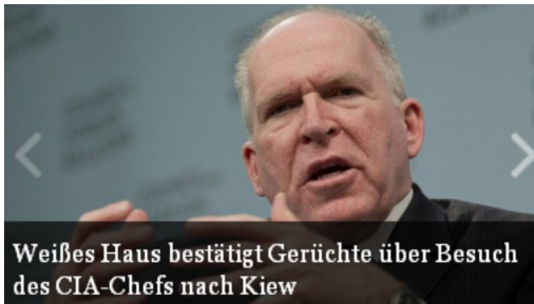
Weißes Haus bestätigt Gerüchte über Besuch des CIA-Chefs nach Kiew